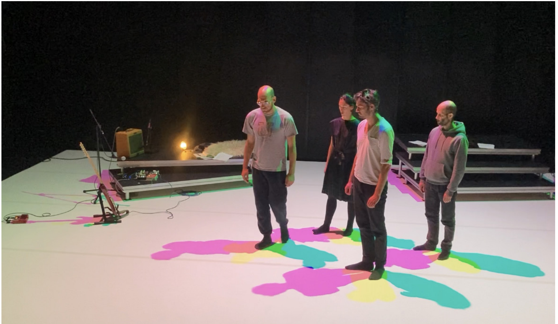
Répétitions au Théâtre de l'Aquarium (75) en oct. 24