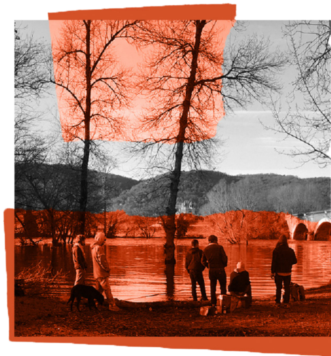
Gwen, les garçons et la rivière